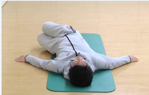
②両膝を合わせたまま、左にゆっくりと倒します