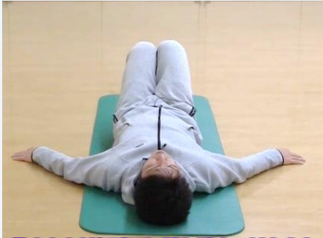
①あおむけに寝て、膝と膝をつけたまま両膝を立てる。両手は左右に広げ、手のひらは上向きでも下向きでも構いません

日本老年医学会が2014年に提唱した概念で、健康な状態と要介護状態の中間に位置し、身体的機能や認知機能の低下が見られる状態を指すが、「適切な治療や予防を行うことで要介護状態に進まずに済む可能性がある」とされており、健康な状態と日常生活でサポートが必要な介護状態の中間を意味する。