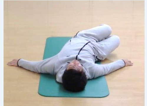
③次に、左にゆっくりと倒します