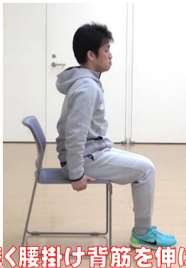
浅く腰掛け背筋を伸ばす

フレイルとは 日本老年医学会が2014年に提唱した概念で、健康な状態と要介護状態の中間に位置し、身体的機能や認知機能の低下が見られる状態を指すが、「適切な治療や予防を行うことで要介護状態に進まずにすむ可能性がある」とされており、健康な状態と日常生活でサポートが必要な介護状態の中間を意味する。