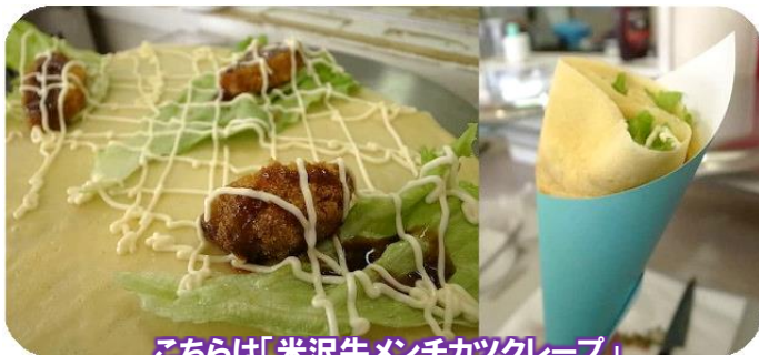
こちらは「米沢牛メンチカツクレープ」 フードメニューも取り揃えています