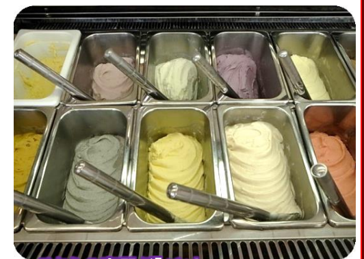
こちらの容器が「バット」 全国各地で販売されているジェラートは、 グレイスさんで製造されたものかもしれません(=)