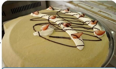
トッピングをして