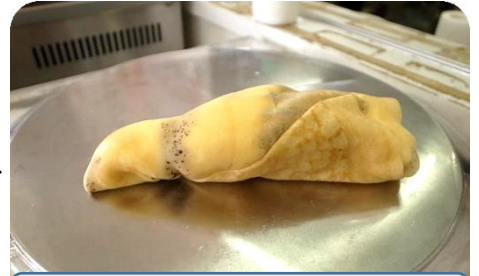
くるくる巻いたら出来上がり♪