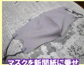
マスクを新聞紙に乗せ