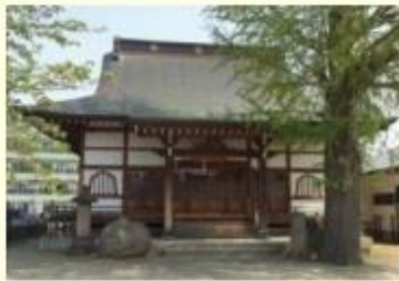
日蓮宗 大法寺 福島県会津若松市御旗町1-9