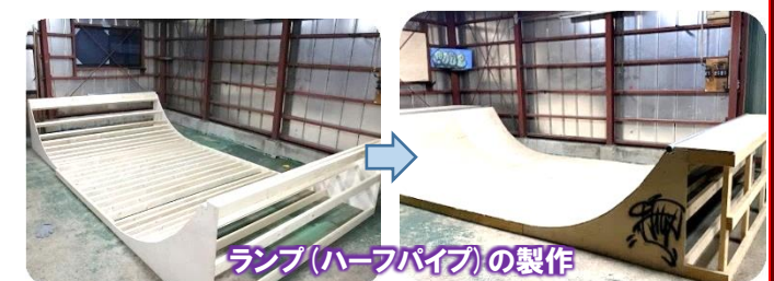
ランプ(ハーフパイプ)の製作