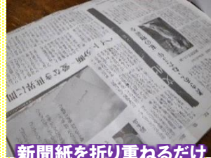
新聞紙を折り重ねるだけ