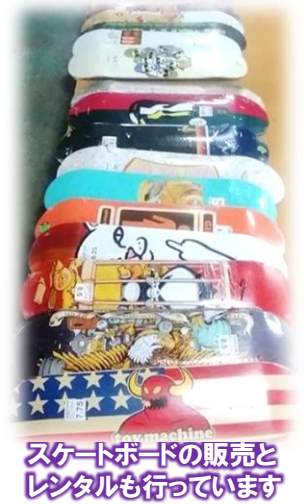
スケートボードの販売とレンタルも行っています

当店のご利用料金は一回500円です。(12時~21時まで滑り放題) お客様の中には、親子でご利用される方もいらっしゃいます。スケートボードをお持ちでない方にはレンタルもしていますので、未経験の方もお気軽にお越しください。 一から丁寧に教えていますので、たった一日でスイスイ滑れるようになります方もいますよ。一緒に楽しく遊びましょう。