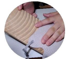
マスクも優しく洗えます